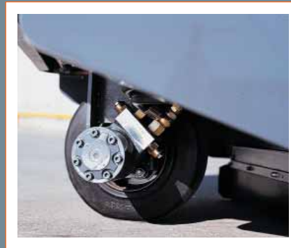
Stufenloser, hydrostatischer Fahrtrieb (auch bei Batteriebetrieb)

Fazit: Ihre Zufriedenheit basiert auf dem weltweit exklusiven Staubfilter und der innovativen DULEVO-Technologie!