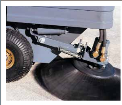
Hydraulisch angesteuerter Seitenbesen und Hauptkehrwalze