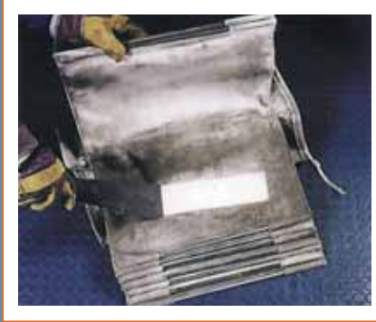
DULEVO-Taschenfilter mit 3 Jahren Garantie